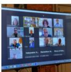
Collegamento da remoto